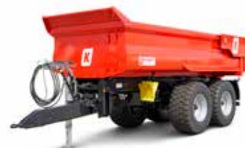
MUP 20SP (20-24 t össztömeg)