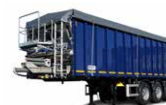
SAW 36 (36 t össztömeg)