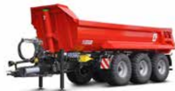
MUP 30HP (31-34 t össztömeg)