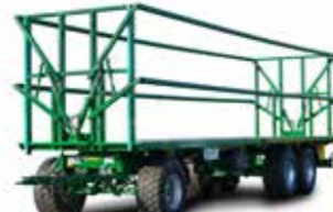
PWO 24 (24 t össztömeg)