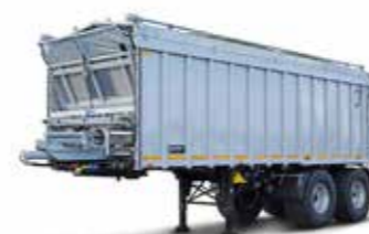
SAW 32 (32 t össztömeg)