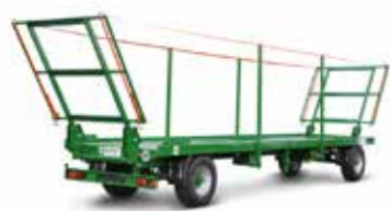
PWO 18 (18 t össztömeg)