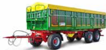
HKD 402 (24 t össztömeg)