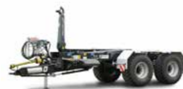
THL 20 (20-24 t össztömeg)