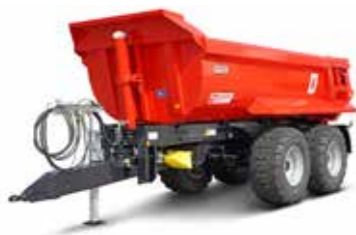
MUP 20HP (20-24 t össztömeg)