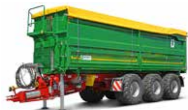
MUK 402 (31-34 t össztömeg)