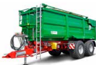
MUK 303 (20-24 t össztömeg)