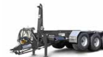
THL 30 (31-34 t össztömeg)