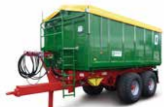
TKD 302-S (20-24 t össztömeg)