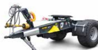
EAD 14 (14 t össztömeg)