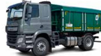
ZKA 1 (16 t össztömeg)