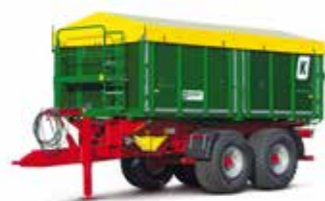
TKD 302 (20-24 t össztömeg)