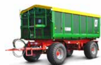
HKD 302-S (18 t össztömeg)