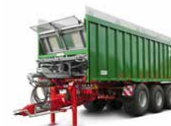
TAW 30 (31-34 t össztömeg)