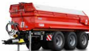
MUP 30SP (31-34 t össztömeg)