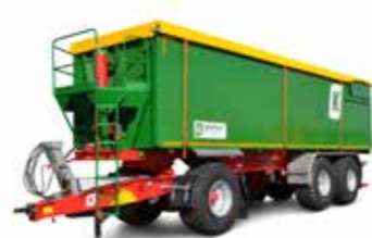
TMR 34 (34 t össztömeg)