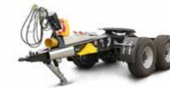
TAD 22 (22 t össztömeg)