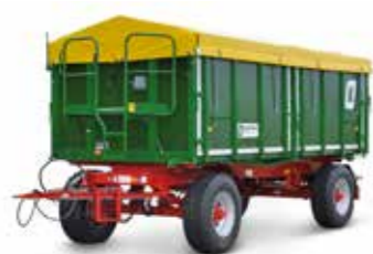
HKD 302 (18 t össztömeg)